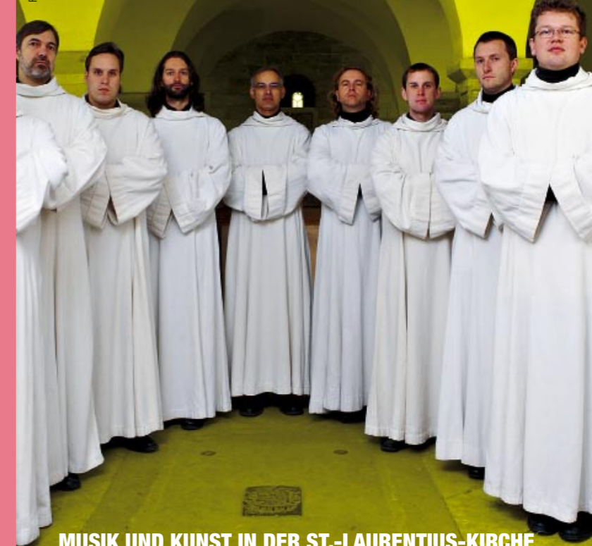
MUSIK UND KUNST IN DER ST.-LAURENTIUS-KIRCHE