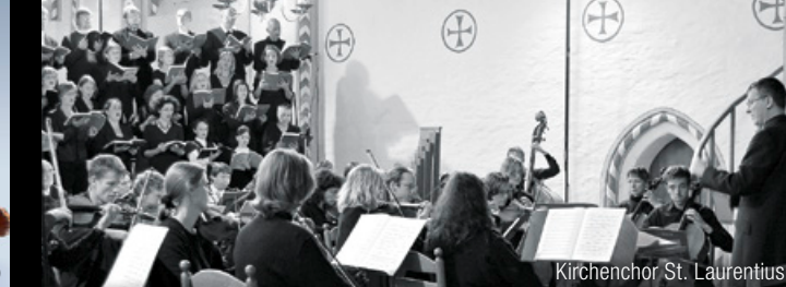
Kirchenchor St. Laurentius