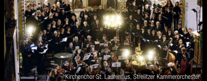
Kirchenchor St. Laurentius, Strelitzer Kammerorchester