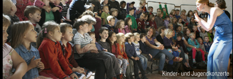
Kinder- und Jugendkonzerte